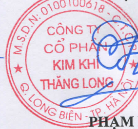
PHẠM HỮU HÙNG